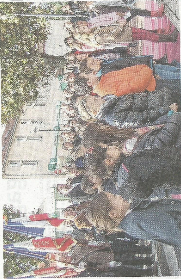
■ Le conseil municipal junior se recueille pendant la minute de silence.